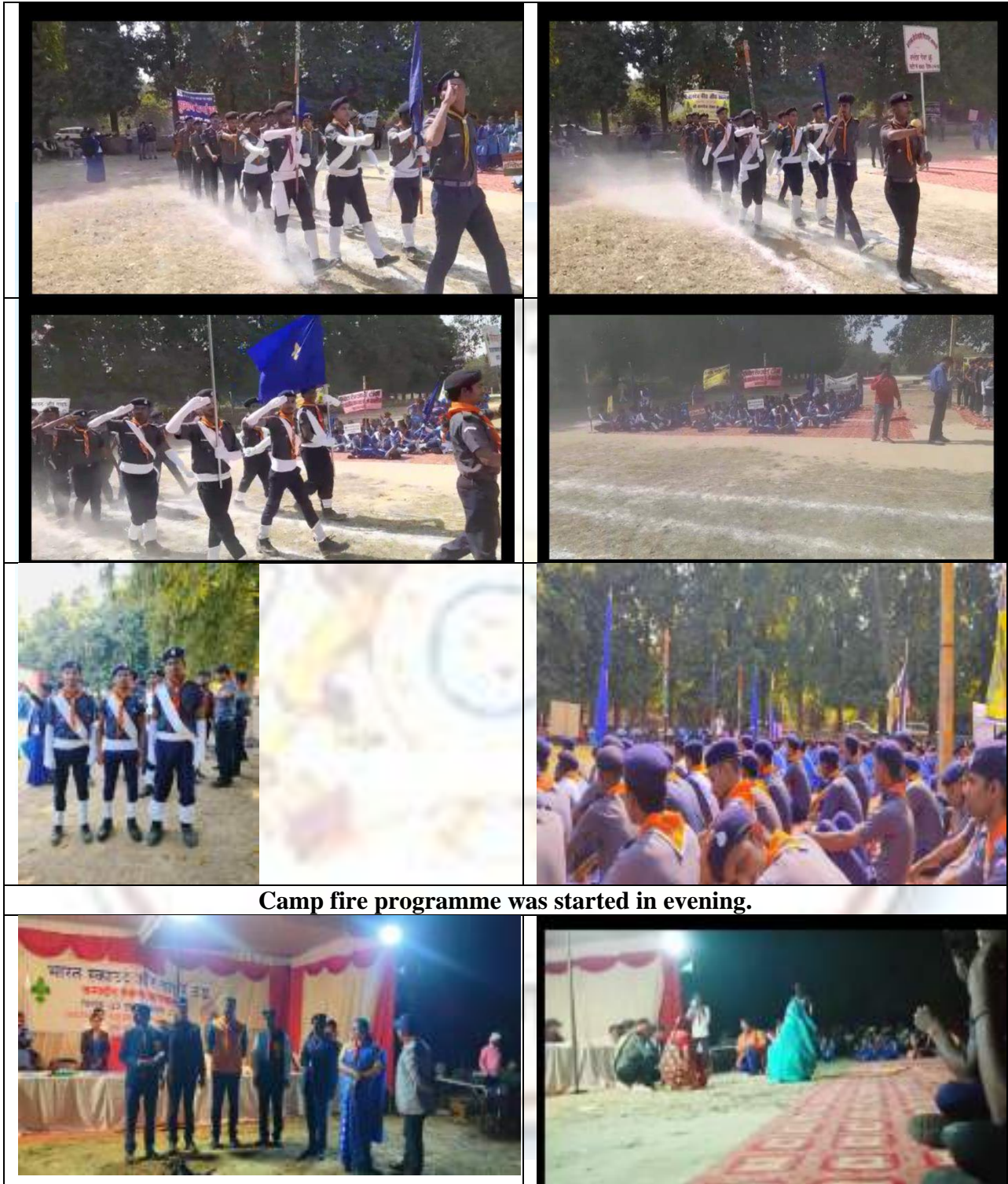
Camp fire programme was started in evening.