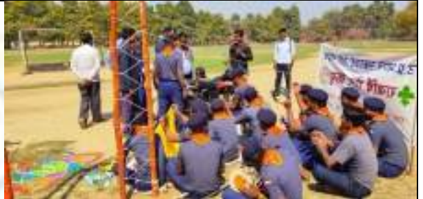
Award distribution- Udai Pratap College got First Position in Rangers and Second Position in Rovers in Janpadiya Samagam.