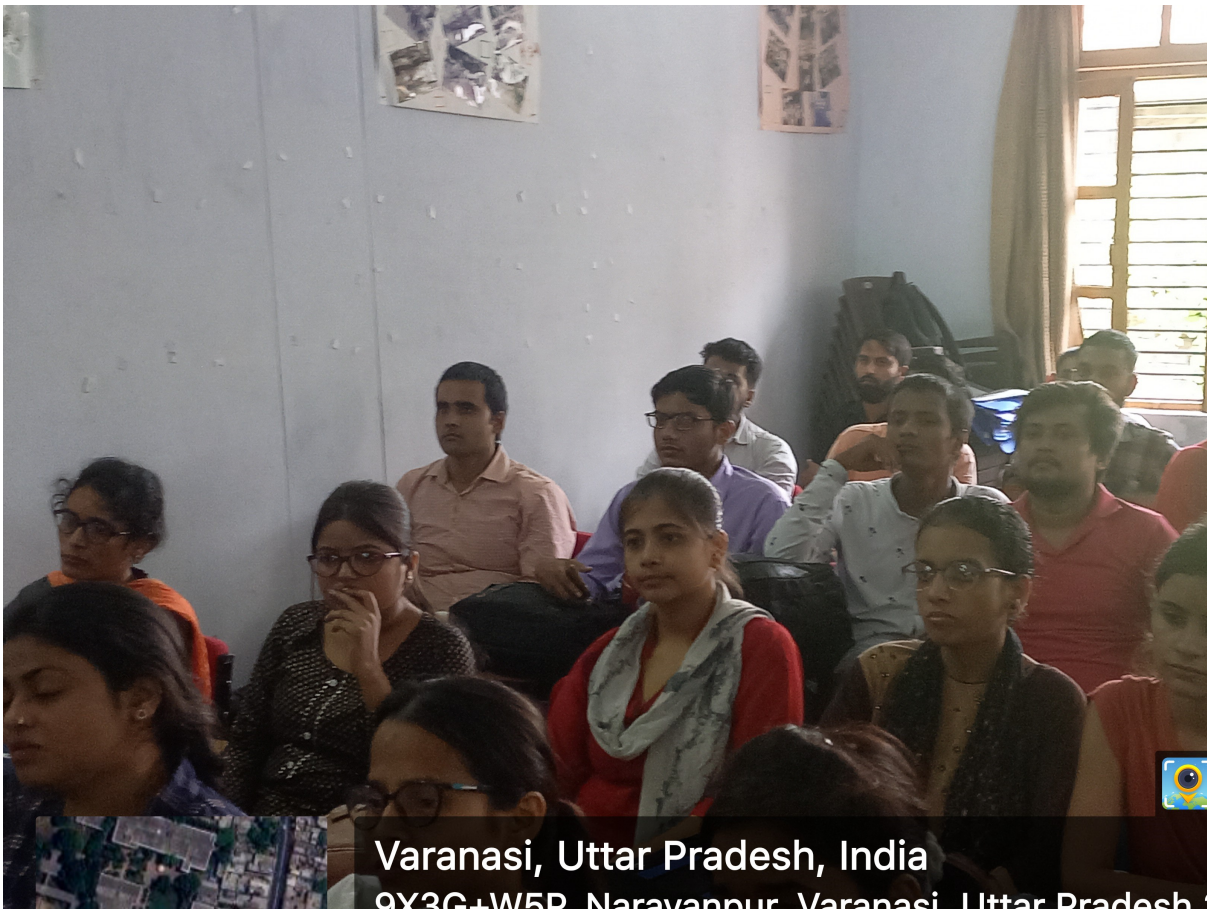
Varanasi, Uttar Pradesh, India 9X3G+W5P, Narayannur, Varanasi, Uttar Pradesh